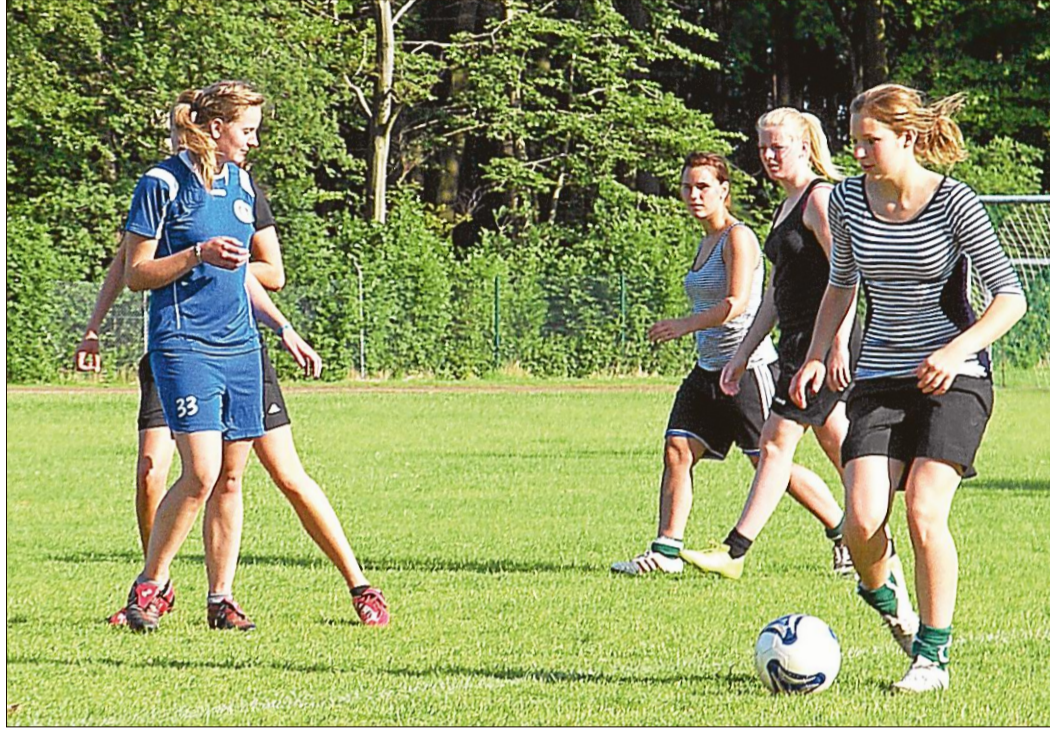
Die Jeveranerinnen geben im Zweikampf alles.

Jedoch gaben sie auch zu, dass der Männerfußball im Allgemeinen interessanter sei.