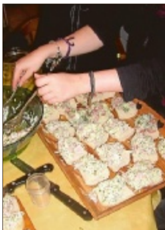
Die halben Brötchen werden mit dem Pizzabelag bestrichen und kurz gebacken. Sie schmecken kalt und warm.