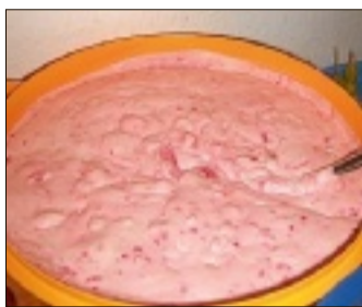
Sieht komisch aus – schmeckt aber absolut lecker: Der Himbeernachtisch.