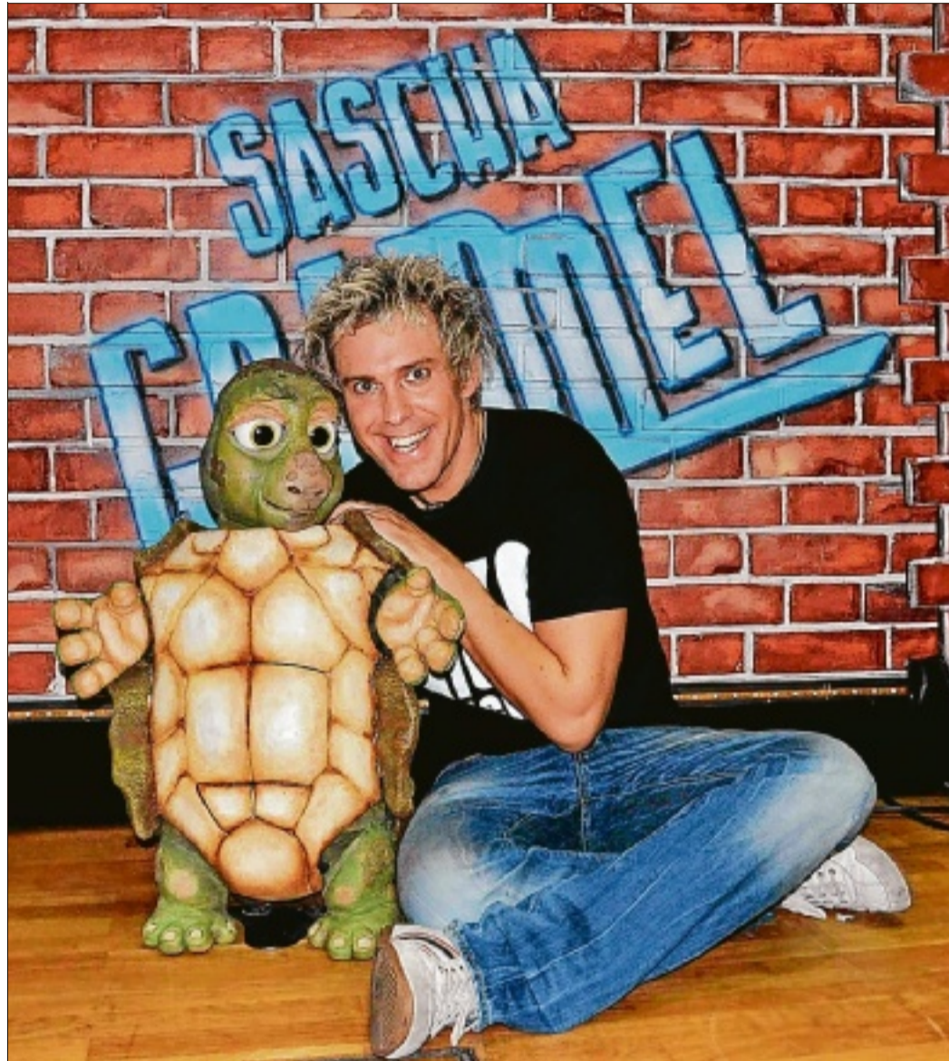
Sascha Grammel mit seiner Puppet Josie vor seinem Auftritt in Oldenburg.