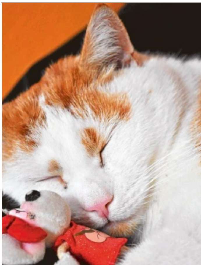
„Oh du meine süße kleine Kuschelmaus“, scheint sich Kater Felix in diesem Moment zu denken – oder er genießt

ganz einfach die ungewöhnliche Schmusestunde mit seiner plüschigen Freundin, der Diddl-Maus ...